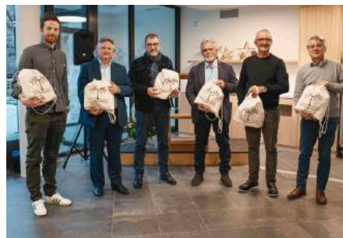
Nelle foto alcuni dei momenti dell'inaugurazione della nuova ala del Centro Sanitario

biente accogliente, armonioso e coerente nelle scelte di materiali, colori e stile. A sua volta, Ganzoni ha ricordato di aver seguito il progetto in prima persona ed è intervenuto esprimendo particolare soddisfazione per il lavoro svolto. Ha messo in luce l'impegno congiunto di tutte le parti coinvolte a partire dal 2023 e ha richiamato l'attenzione sulle infrastrutture tecniche complesse, chilometri di tubi e cavi, che scorrono dietro pareti e pavimenti, testimonianza di un lavoro intenso e spesso in-