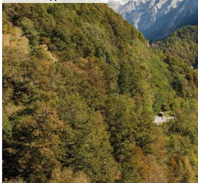
Il Centro Sanitario Bregaglia visto dall'alto

iniziata come "Ospedale - Casa di cura della Bregaglia" nel 1902 per diventare, esattamente il 1° gennaio del 2016, la moderna struttura che conosciamo oggi. L'istituto si sviluppa su due piani, con 34 posti letto a disposizione degli ospiti e delle persone affette da demenza o da altre malattie neurodegenerative come l'Alzheimer. Oltre alla casa di riposo, il centro vanta un ampio ventaglio di prestazioni veicolate tempestivamente grazie a uno studio medico presidiato H24 da medici di base, senza dimenticare il reparto per le cure acute (4 letti). Il servizio "Spitex" di assistenza a domicilio, con consegna pasti, e le attività di fisioterapia interna e ambulatoriale completano l'offerta. «Lo studio medico rappresenta il fiore all'occhiello dell'istituto e si rivolge a una popolazione di circa 1.500 abitanti che, diversamente, dovrebbero recarsi nella vicina valle Engadina - ha spiegato Maria Magnini, primario e medico specialista FMH in Medicina Interna Generale, abilitazione MTC e